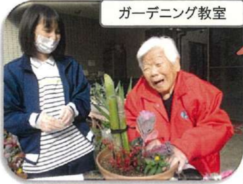
ガーデニング教室

♥デイサービスは一日定員45名(要介護者30名・要支援者等15名)の日帰りサービスです。住み慣れた家で安心して過ごせるよう、活動・参加を目指した機能訓練を実施しています。