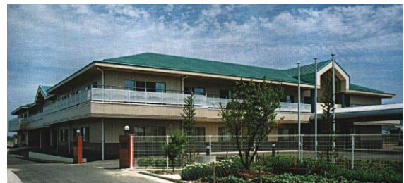
(愛生苑建物の外観)

※JRで来られる方は、八十場駅を降り、左へ歩いて下さい。すぐに、押しボタン信号があります。そこを渡り、まっすぐ歩いていくと県道16号線に出ます。16号線まで出ると愛生苑が見えます。(所要時間約15分)